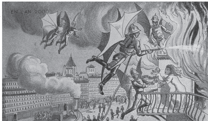
Bombeiros (1910) e Ônibus-baleia (1899), da série "No ano 2000", cartões-postais por Jean-Marc Côté, ilustrador francês, retratam os avanços científicos que se supunham alcançados no ano 2000.